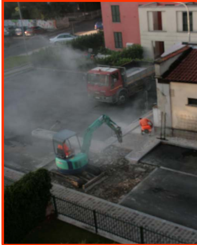
Rimozione del dosso di Via Bacchelli

Ma qualcosa sta cambiando. La Giunta Lega-PdL sta infatti inaugurando la nuova filosofia di gestione dell'ambiente urbano che definiremo A.C.O. (Automobili comunque e ovunque) . Il primo segno lo si è avuto con la rimozione di un buon numero di “dissuasori” di velocità collocati sulle nostre strade. Altri provvedimenti sono già in itinere, ma qui ci soffermiamo solo sul tema dissuasori (o dossi che dir si voglia) e limitatamente al capitolo “sicurezza”, tralasciando per sole ragioni di